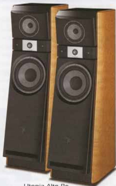
Utopia Alto Be

Au service de vos émotions audio-visuelles T (450) 467 8273 / SF 1 (800) 690 8273 / F (450) 467 8822 info@multielectronique.com / www.multielectronique.com 67, boul. Sir Wilfrid-Laurier, Belœil (Québec) J3G 4G2 CANADA